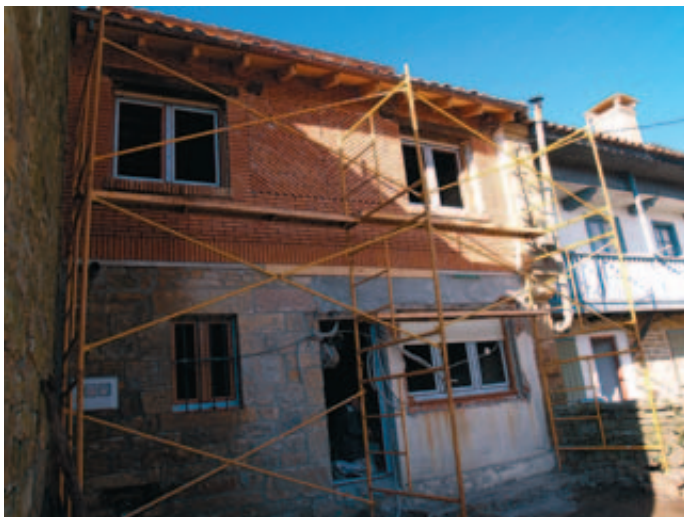
El Plan de Rehabilitación incluye por primera vez intervenciones en las zonas rurales.

El Plan Estatal de Vivienda y Rehabilitación marca también como línea estratégica la mejora de la eficiencia energética y la accesibilidad de las viviendas, integrando dentro de su propia estructura el Programa Renove, que incluye la rehabilitación aislada de edificios. Entre las actuaciones protegidas figuran la instalación de paneles solares para agua caliente sanitaria; la mejora de la envolvente térmica del edificio y otras que incrementen su eficiencia energética o la utilización de energías renovables; la instalación de mecanismos que favorezcan el ahorro de agua y