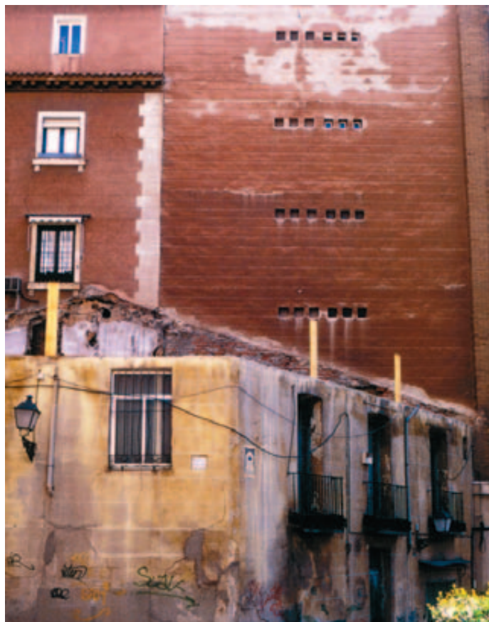
El Ministerio presentará pronto un análisis pluridisciplinar de los barrios desfavorecidos de España con información de las ciudades de más de 50.000.

La FEMP considera que los Consistorios son los agentes adecuados y más preparados para aplicar el Plan del Gobierno con resultados más satisfactorios