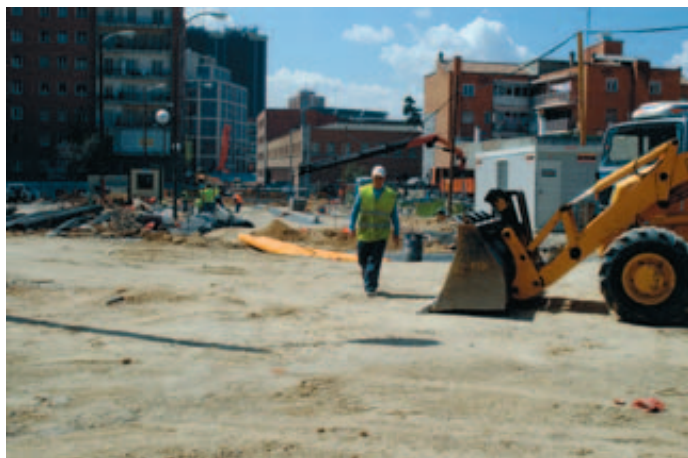
Las Áreas de Renovación Urbana incluyen la demolición y sustitución de edificios, urbanización, creación de dotaciones y equipamientos y mejora de la accesibilidad.

para la comunidad de propietarios que pueden llegar a 1.100 euros por vivienda y para los propietarios u ocupantes hasta 2.700 euros por vivienda. La rehabilitación de viviendas cuenta con subvenciones de hasta 3.400 euros que podrán llegar a 6.500 euros cuando se destine al alquiler durante cinco años. Además, para las nuevas construcciones existen ayudas de hasta 3.500 euros cuando superen la calificación energética mínima establecida en el Código Técnico de la Edificación.