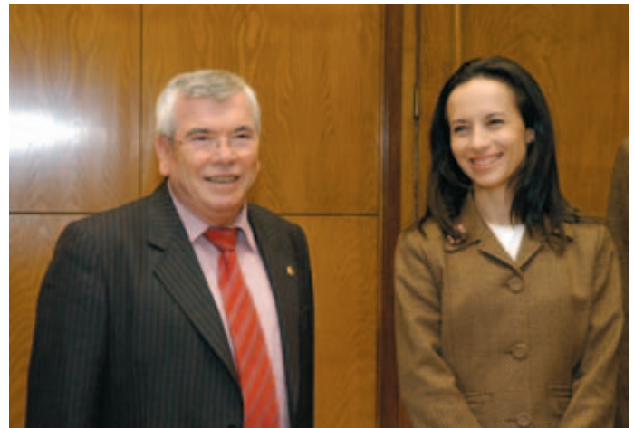
El Ministerio de Vivienda quiere impulsar la creación de una red de oficinas técnicas de apoyo a los ciudadanos, con la participación de todas Administraciones. En la imagen, Beatriz Corredor con Pedro Castro, en una reciente reunión entre ambos.