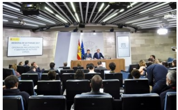
Presentación de la Comisión Interministerial para la incorporación de criterios sociales en la contratación pública.

Este órgano se constituye en el marco de la nueva Ley 9/2017, de 8 de noviembre, de Contratos del Sector Público, por la que se transponen al ordenamiento jurídico español las directivas europeas que establecen el nuevo marco jurídico en materia de contratación. Dicha norma plantea la condición de la contratación pública como instrumento para establecer estrategias de carácter social.